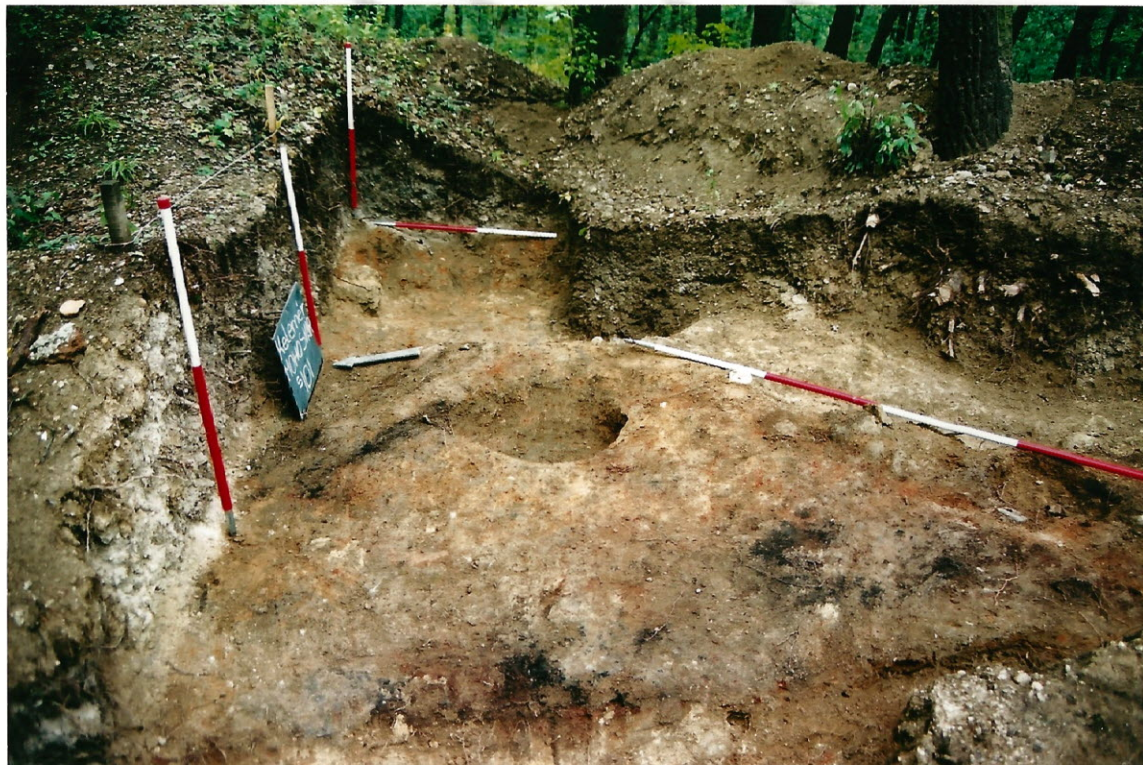
Kelemér-Mohosvár 2002. évi régészeti feltárásai 58. C:\Kelemer_2002_foto\Kelemer_2002_neg\Kn02-1-9